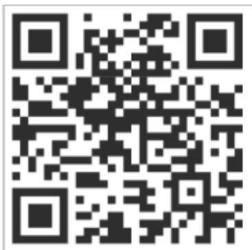
Qr Code EQUITV