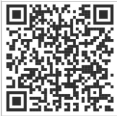
Qr Code MASAFA